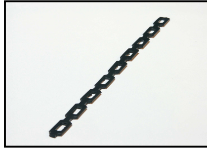
Chainlock Nr 2+3